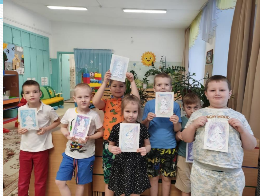
Аппликация на тему: «Заснеженная ёлочка»