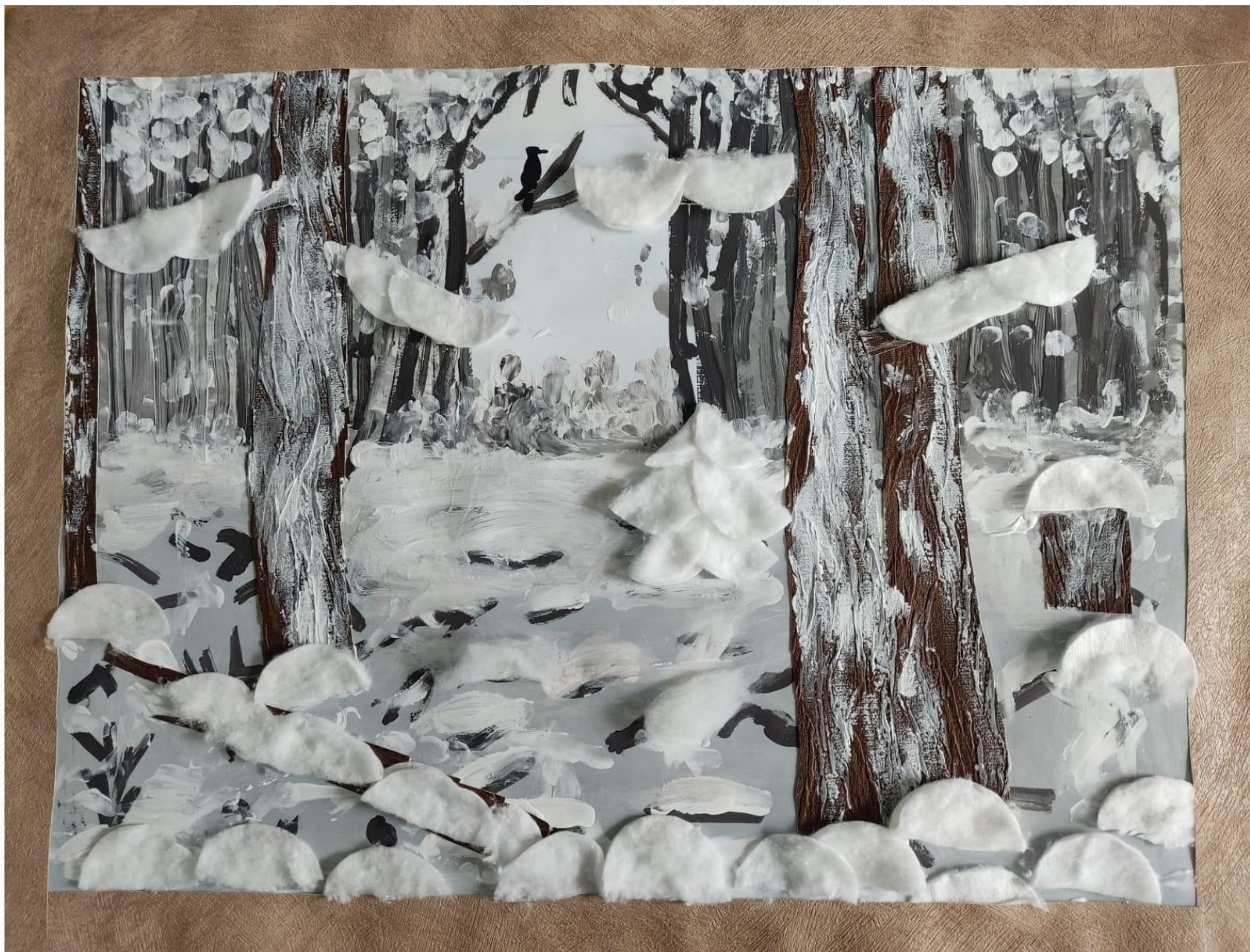
«Зима в лесу»