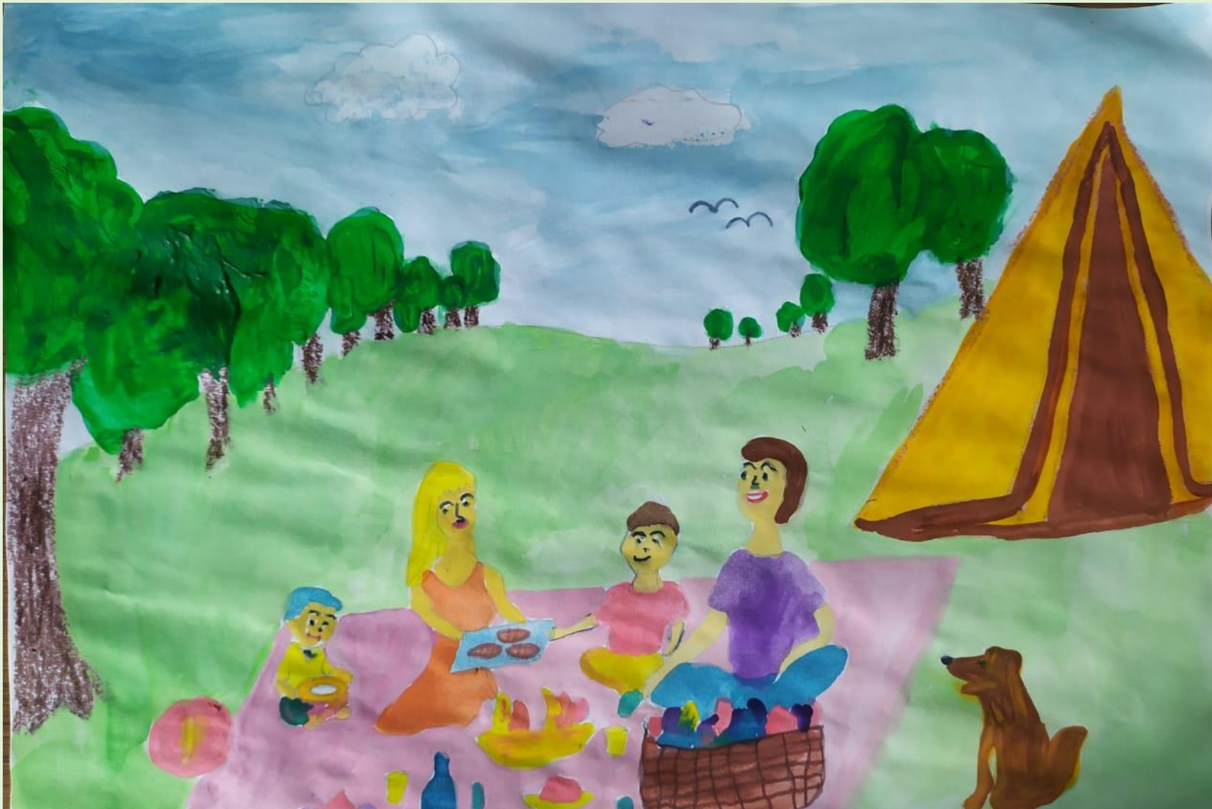
Изобразительная деятельность «Правила поведения на природе»